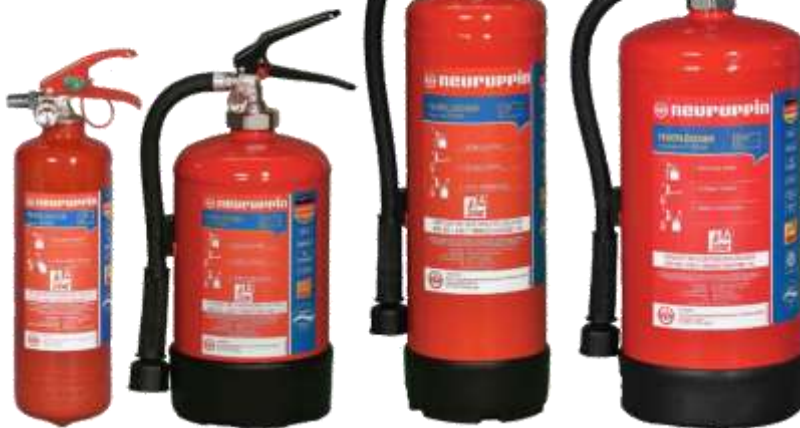
LiPo bis 317Wh Handy