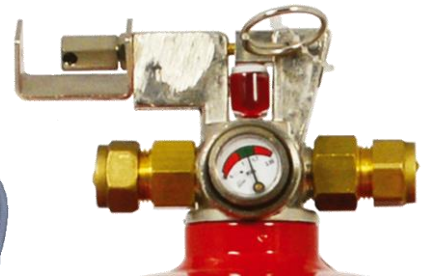
Optional elektrischen Aktuator Art.-Nr.: 302 120 0004